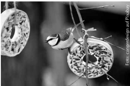
Dass nicht so viele Vögel wie üblich zur Futterstelle kommen, kann verschiedene Ursachen haben.

Experten des NABU konnten anhand der langjährigen Zählung nachweisen, dass die winterlichen Vogelbeobachtungen in den Gärten stark von der Witterung