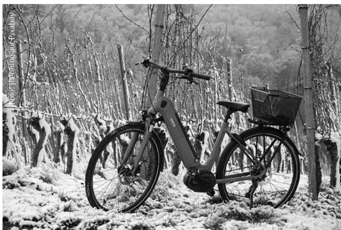
Mit der richtigen Ausrüstung und ein paar Kniffen lässt sich die Fahrt mit dem E-Bike auch in den ungemütlicheren Monaten genießen.

Nach der Ausfahrt benötigen E-Bikes und ihre Energiespeicher die richtige Pflege. Die Experten von Bosch etwa empfehlen, den Akku vom E-Bike zu entnehmen und besser trocken und bei Raumtemperatur zu lagern. Auch das Laden von Akkus mit Lithium-Ionen-Zellen sollte bei Raumtemperatur erfolgen. Und damit das E-Bike lange in Topform bleibt, sollten Radfahrer unterwegs gesammelten Schmutz und den Mix aus Spritzwasser, Matsch oder Schnee mit Wasser und Spülmittel abwaschen. (djd).