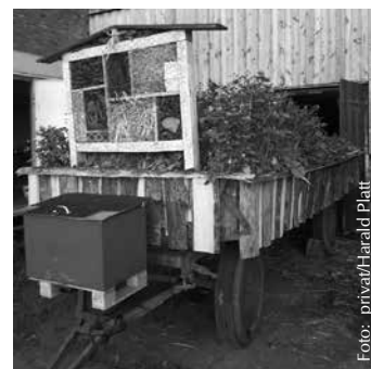
Der Wagen wird an verschiedenen Orten im Landkreis Station machen. In der Box finden Interessierte kostenlose Blümmischungen für zuhause.