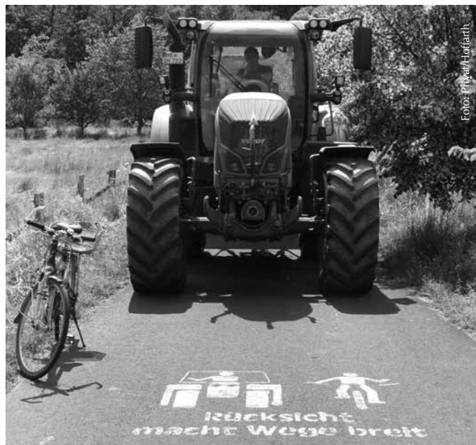
Mit den großen Maschinen hat der Landwirt auf dem Wirtschaftsweg keine Möglichkeit mit angemessenem Sicherheitsabstand zu überholen, wenn die Radfahrer nicht Platz machen.

Radfahrer und Spaziergänger sollten auf den Grünstreifen oder an den Wegesrand treten, wenn ein Landwirt mit seinem breiten Fahrzeug vorbeifahren möchte. Denn ein Ausweichen ist nicht immer möglich, da die Ränder der Feldwege Schaden nehmen könnten, weil sie nicht für das Gewicht der schweren Maschinen ausgelegt sind. Darüber hinaus besteht die Gefahr, dass das ganze Gespann umkippt. Ebenso sollte dringend ver-